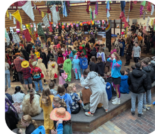
Schmutziger Donnerstag an der RSSTG