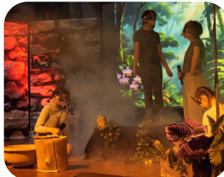
Auftritt der Musical-AG