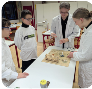
Experimentieren am Tag der offenen Tür

Wir fördern die Entwicklung der Lebenskompetenz, dazu entdecken unsere Schüler*innen ihre Stärken auch durch praktische Erfahrungen.