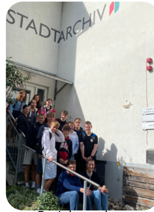
Projektwoche - Spurensuche Geschichte