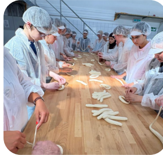
Besuch Bäckerei Brantner